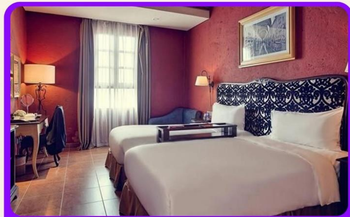
พักบนบานาฮิลล์ 1 คืน