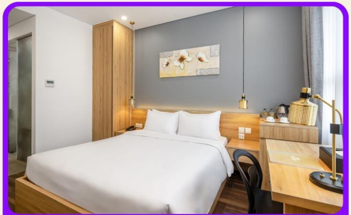
พักเมืองดานัง 4 ดาว 2 คืน