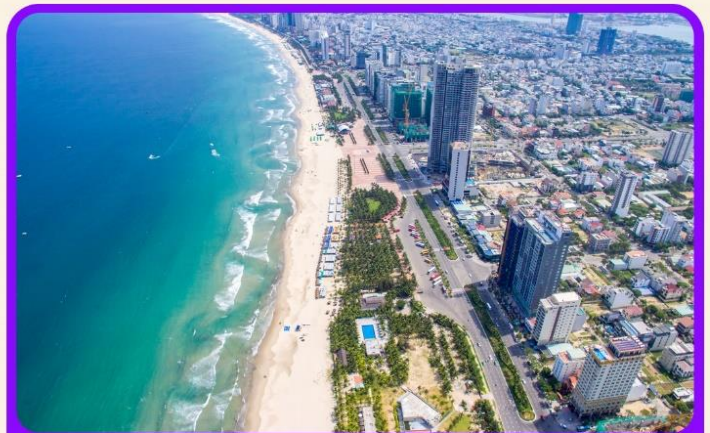
เช็คอิน ชายหาดหมีเคอ เป็นชายหาดที่สวยงามที่สุดในเมืองดานัง