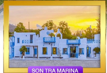
SON TRA MARINA