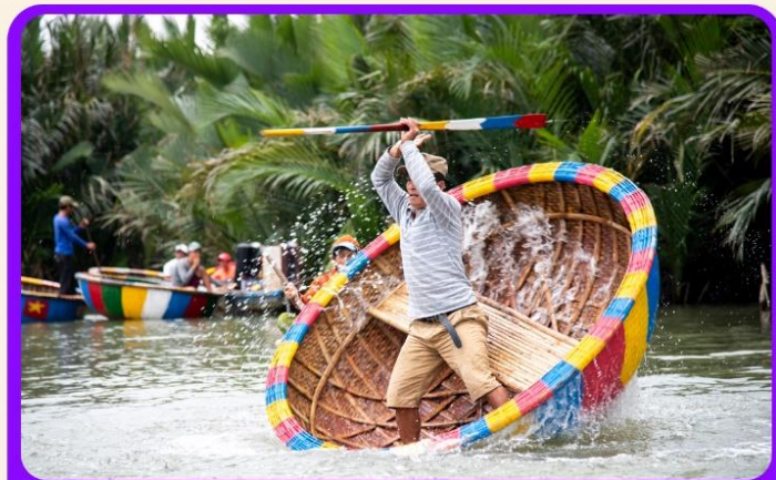
พิเศษ !!! นั่งเรือกระดัง UNSEEN เวียดนาม